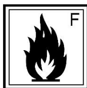
Rótulo peligro subsidiario