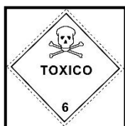
Rótulo peligro principal

Distintivo según NCh2190 : Sustancia tóxica (Clase 6.1)/ Líquido inflamable (Clase 3).